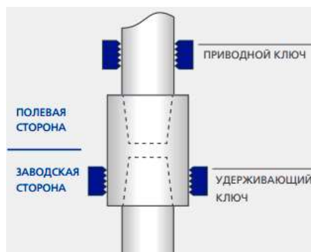
Рисунок 5 – Положение ключей при развинчивании

4.3.7.2 Для развинчивания труб при подъеме колонны насосно-компрессорных труб трубный ключ следует размещать близко к муфте, но не вплотную, так как необходимо исключить даже небольшое сдавливающее действие плашек трубного ключа на поверхность трубы (рисунок 5).